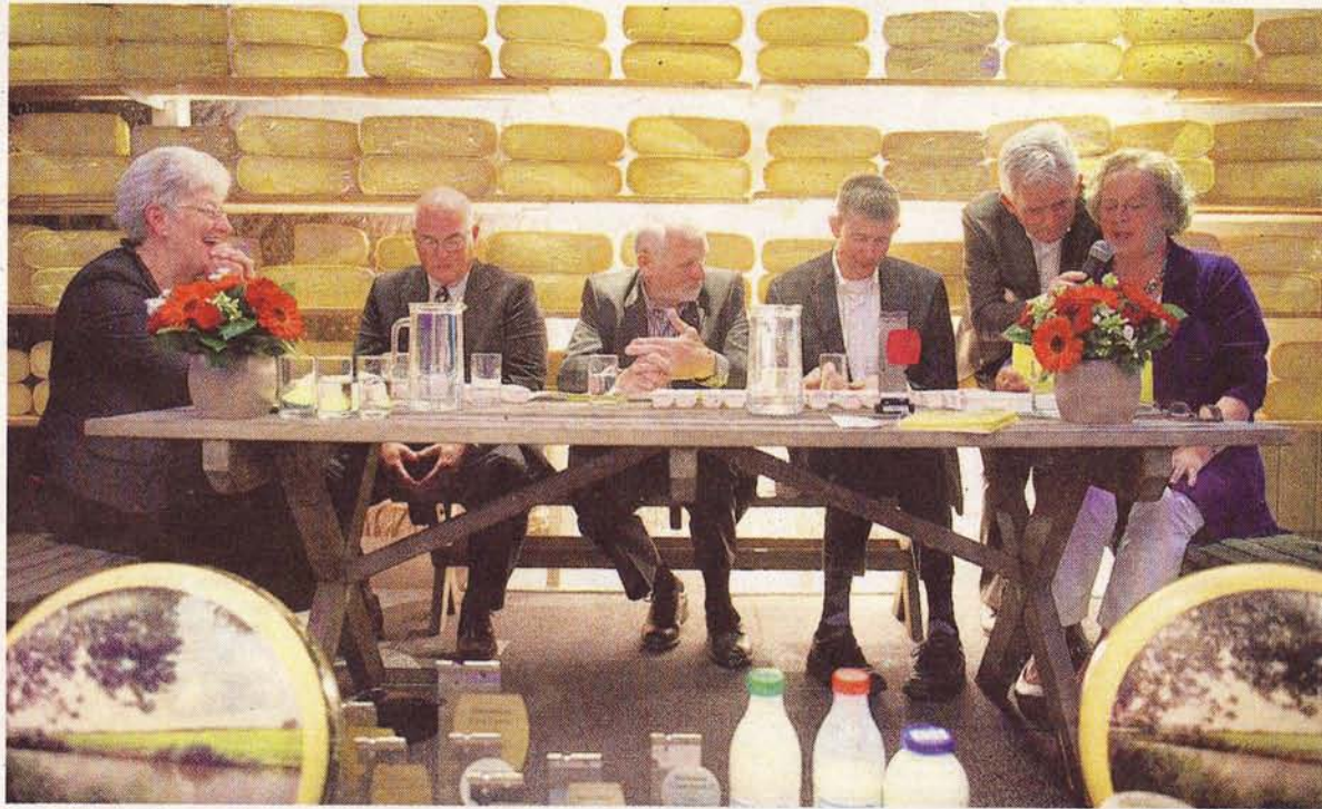
De jury in vol beraad.